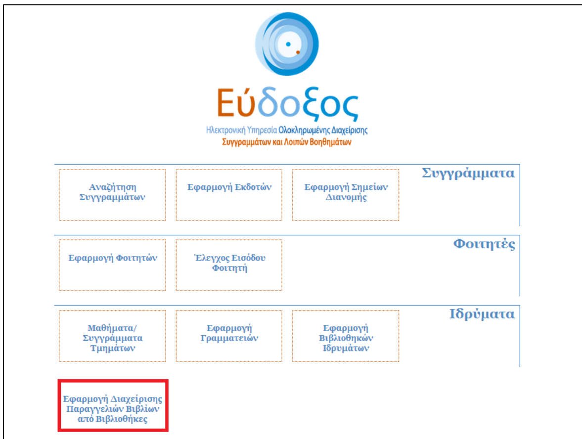
Εικόνα 1: Είσοδος στην εφαρμογή

Ο χρήστης, μετά την πιστοποίηση του λογαριασμού του, μπορεί να εισέλθει στην εφαρμογή μέσω της διεύθυνσης https://service.eudoxus.gr/ επιλέγοντας «Εφαρμογή Διαχείρισης Παραγγελιών Βιβλίων από Βιβλιοθήκες» χρησιμοποιώντας το όνομα χρήστη και τον κωδικό πρόσβασης που δήλωσε κατά την εγγραφή του στο σύστημα (Εικόνα 1 και 2).